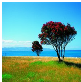
Pohotukawa of Christmastree

flora met veel boomsoorten ten gevolge van het ontbreken van herkauwers en knaagdieren. De bekendste boom is wel de Kauri, deze kan meer dan 2000 jaar oud worden. Altijd groene loofbomen zijn de Beeche's, Rata, Kowhai en de Pohutukawa welke laatste rond kerstmis bloeit en de nationale trots is van de Nieuwzeelander. Boomvarens zoals Ponga en Mamaku worden 10 tot 20 meter hoog en hebben bladeren van wel 6 meter lang en 2 meter breed.