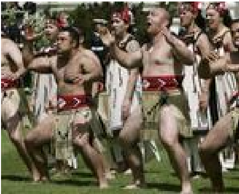
Een welkomstdans van een groep Maori

Duizend jaar geleden kwamen de Maori's vanuit Polynesië naar N.Z.. Zij vormen niet één volk maar bestaan uit verschillende stammen. Veel stammen vechten een onderlinge strijd uit binnen versterkte nederzettingen (Pa), er is ook kannibalisme. Immigranten uit Melanesië of Micronesië worden verdreven.