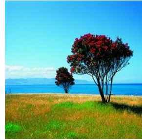
Pohotukawa of Christmastree

flora met veel boomsoorten ten gevolge van het ontbreken van herkauwers en knaagdieren. De bekendste boom is wel de Kauri, deze kan meer dan 2000 jaar oud worden. Altijd groene loofbomen zijn de Beeche's, Rata, Kowhai en de Pohutukawa welke laatste rond kerstmis bloeit en de nationale trots is van de Nieuwzeelander. Boomvarens zoals Ponga en Mamaku worden 10 tot 20 meter hoog en hebben bladeren van wel 6 meter lang en 2 meter breed.