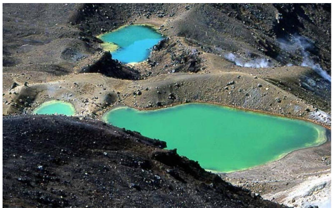
Vulkaankraters in het Tongariro NP

Nieuw-Zeeland telt plm. 35 nationale parken welke worden beheerd door het Department of Conservation. Het oudste is het Tongariro national Park met Mt.Ruapehu. Dit park werd al in 1887 door maori's aan de kroon geschonken om het te beschermen. Omdat N.Z. een vulkanische bodem heeft zijn er gemiddeld per jaar zo'n 120 aardbevingen meetbaar.