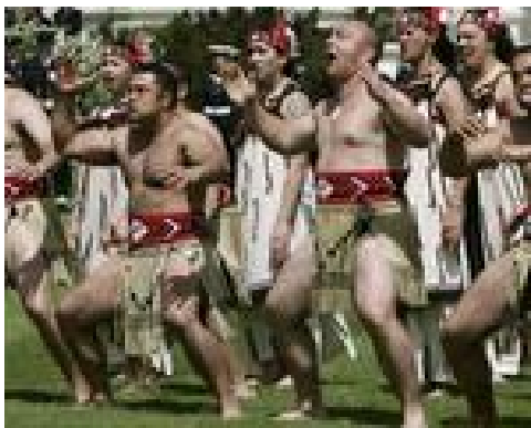
Een welkomstdans van een groep Maori

Duizend jaar geleden kwamen de Maori's vanuit Polynesië naar N.Z.. Zij vormen niet één volk maar bestaan uit verschillende stammen. Veel stammen vechten een onderlinge strijd uit binnen versterkte nederzettingen (Pa), er is ook kannibalisme. Immigranten uit Melanesië of Micronesië worden verdreven.