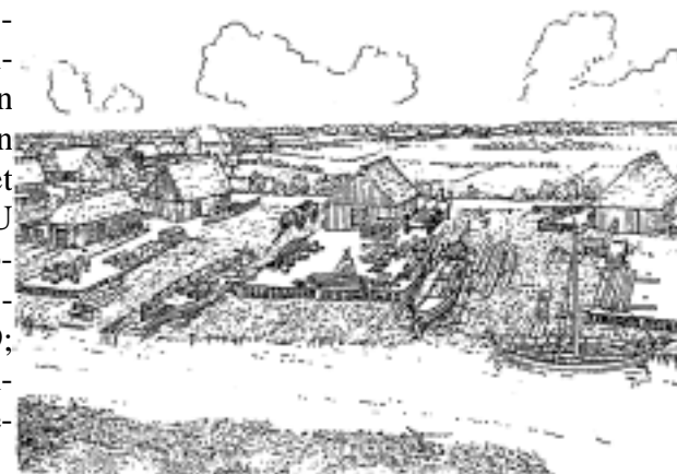
Hollingstedt anno 1200