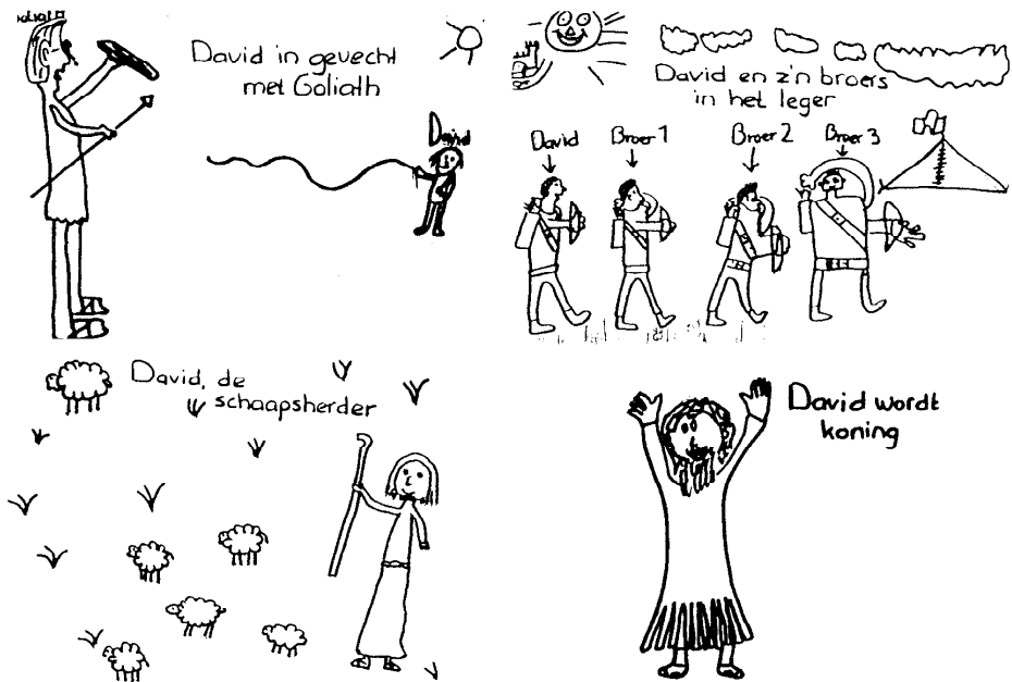
Tekeningen van kinderen van de zondagsschool