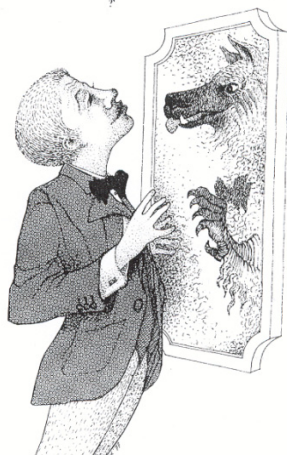
Ik zie mezelf toch niet...?

De tragische kant van dit verschijnsel is, dat veel mensen op den duur in