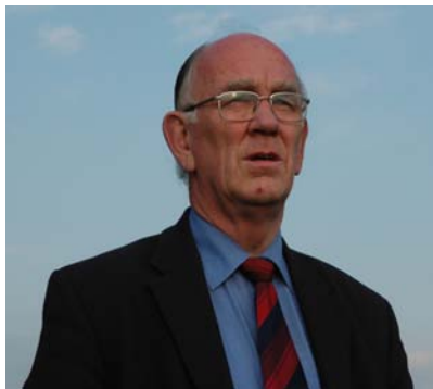
Geen toekomst zonder verjonging