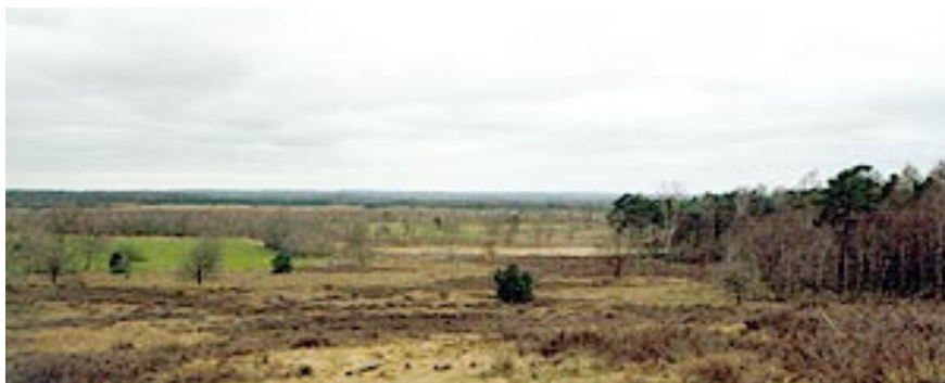
Uitzicht over natuurgebied “de Borkeld”

Voor 9 september ontvangt u dan bericht hoe laat wij van de Eendracht gezamenlijk vertrekken. De kosten kunt u dan aan de penningmeester voldoen. Hij zal dan zorg dragen voor betaling aan de organisatoren.