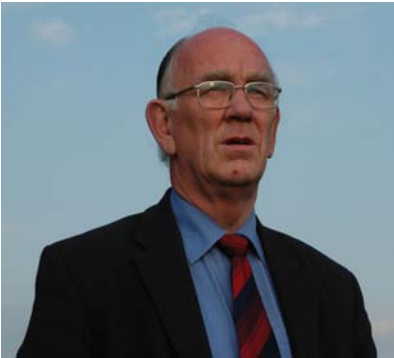
Geen toekomst zonder verjonging