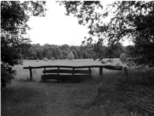
Natuurgebied de Borkeld