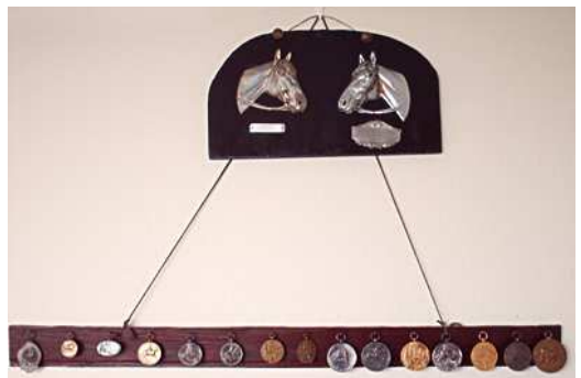
Enkele van de behaalde medailles

Ik begreep de paarden en zij mij. Ik maakte nooit fouten met ze, terwijl ik er nooit voor geleerd heb. Kijk maar eens op die foto. Die is genomen op de Zelhemse Paardenda-