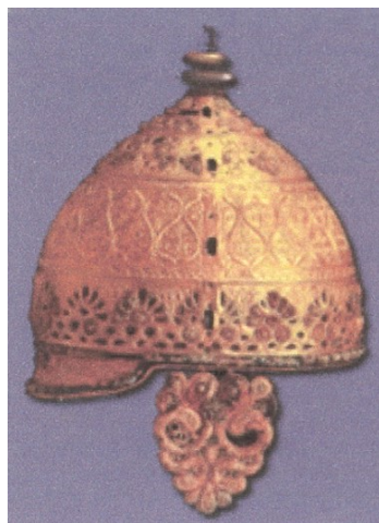
Bronzen helm uit de Keltische La Tène cultuur

Onze cultuur wordt al eeuwen gedomineerd door een Joods-Christelijke vorm van denken, die weer invloeden heeft ondergaan van de Griekse en de Romeinse cultuur. Maar meer dan tweeduizend jaar geleden was dat anders. De volkeren die toen Europa bewoonden waren, o.a. de Kelten en de Germanen. Dit zijn maar verzamelingen voor talloze stammen die er weer een eigen accent aan gaven en zich met elkaar vermengden. Zeker is dat ook het huidige Limburg en Brabant bewoond zijn geweest door Keltische stammen. Er bestond geen centraal gezag en er was waarschijnlijk geen sprake van geschreven woord.