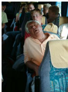
Hollingstedt, terugreis, moe maar voldaan!