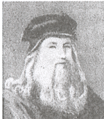
Leonardo da Vinci (1452—1519), Italiaansch schilder ("Laatste Avondmaal", "Mona Lisa", "Gioconda"), ingenieur (vliegtuig, draaiend tooneel), architect, astronoom, anatoom, wis- en scheikundi-

Het verbaasde me enige tijd terug, dat een vriend, die tamelijk wetenschappelijk is ingesteld, mij plompverloren vroeg: "Wat vind jij van de 'da Vinci code'?" Hij vertelde mij erbij dat hij het boek met veel plezier gelezen had. Ik had van hem nooit verwacht dat hij dit boek zou lezen en dan blijkbaar nog wel met zoveel interesse. Mijn reactie was: "Al die geschriften en verhalen die door de auteur worden aangehaald, waren mij niet onbekend. Alleen de verbanden die daar nu tussen worden gelegd, dat was voor mij wel nieuw en dat blijft een kwestie van speculatie. In ieder geval kan het geen kwaad om naast de bekende visies op het leven van Jezus en gebeurtenissen op een andere manier daarnaar te kijken.