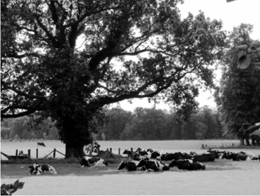
Koeien in de wei