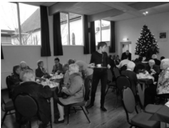
En dan is er koffie...