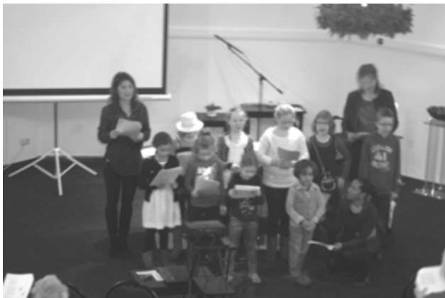
Kinderen en leiding van de Zondagsschool tijdens de Kerstviering