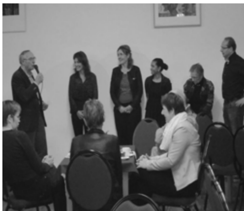
De Zondagsschoolleiding en de pianist worden bedankt door de Zondagsschoolcommissie