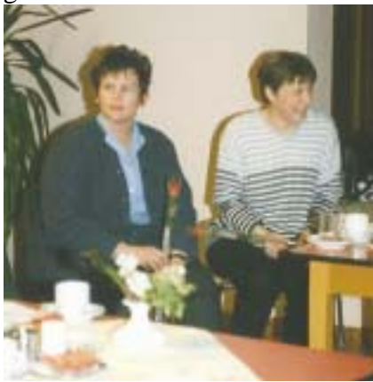
De aftredende bestuursleden.