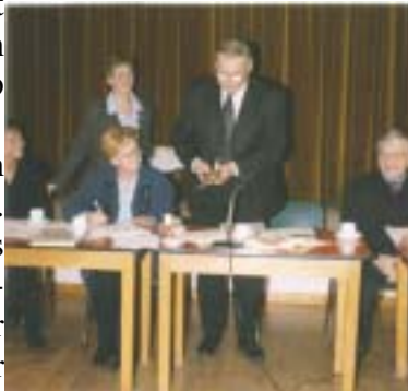
De nieuwe voorzitter.