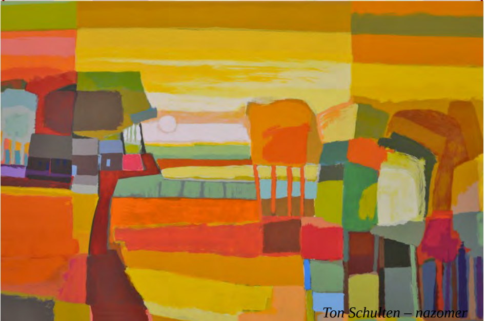
Ton Schulten – nazomer

geven mijmeringen droombeelden van het voorbije onder de voet gelopen door een opvliegende kraai